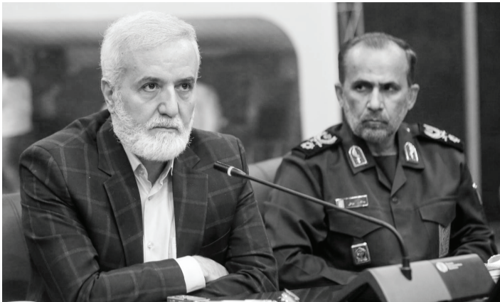
نمایندة مردم شیراز و شهردار شیراز در نشست خبری.

اینکه ۲۲ روستا در بخش دهستان سیاحت‌رانگون و ۹۹ روستا در شهر شیراز هدف‌گذاری طرح محرومیت‌زدایی است، عنوان کرد، در ۹۹ روستایی که همچنان معایب خاکی دارند، معاهدان متجاهر با رویکرد متفاوت با ظرفیت ۳۰۰ نفر آغاز به کار کرده است. فرمانده سپاه فجر استان در پاسخ به پرسش خبرنگار سبحان درباره عدم همپوشانی کمک‌های استان به عنوان یک حق برای استان گفت: حق استان حتی یک ریال هم باید پرداخت شود و اجازه نمی‌دهیم یک ریال استان به دلیل اینکه استان برخوردار و فعال در زمینه حضور خیرین می‌تواند باعث رضایت‌مندی مردم شود. بوعلی در بخش دیگری از صحبت‌های خود به سامان‌دهی معاندان متجاهر اشاره کرد و گفت: سومین مرکز سامان‌دهی درمان و اشتغال‌زایی معاندان متجاهر با رویکرد کمک‌های دولتی به ۳۰۰ نفر آغاز به کار کرده است. فرمانده سپاه فجر استان در پاسخ به پرسش خبرنگار سبحان درباره عدم همپوشانی کمک‌های استان به عنوان یک حق برای استان گفت: حق استان حتی یک ریال هم باید پرداخت شود و اجازه نمی‌دهیم یک ریال استان به دلیل اینکه استان برخوردار و فعال در زمینه حضور خیرین